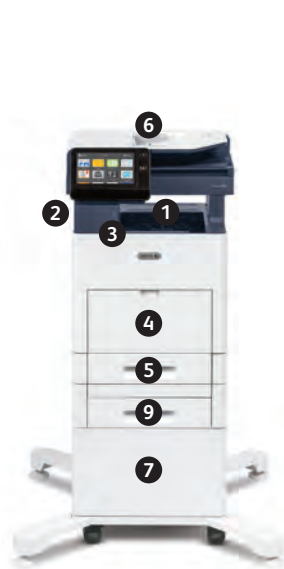
Multifuncional Xerox® VersaLink® B605 Impresión. Copiado. Escaneado. Fax. Correo electrónico.